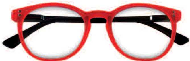
Mod. COLOR rosso - aste multicolori