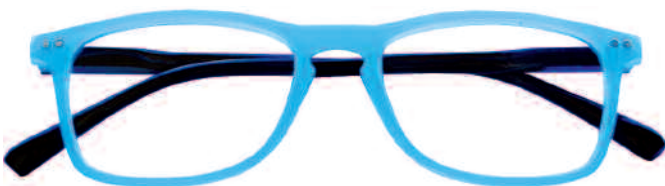
Mod. SPRING frontale azzurro, aste nere