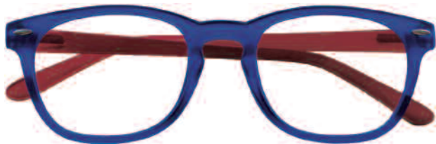
Mod. SATIN frontale blu, aste rosse