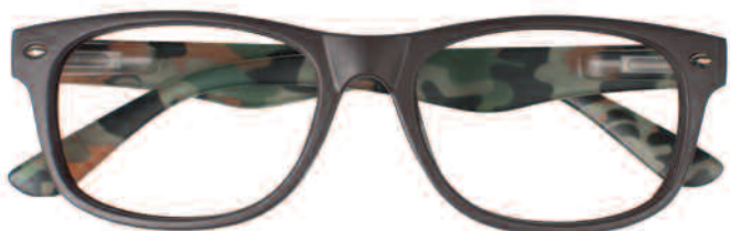
Mod. MIMETIC marrone - aste maculate verde, marrone, grigio