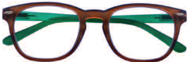
Mod. SATIN frontale marrone, aste verdi