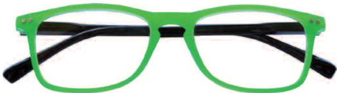
Mod. SPRING frontale verde, aste nere