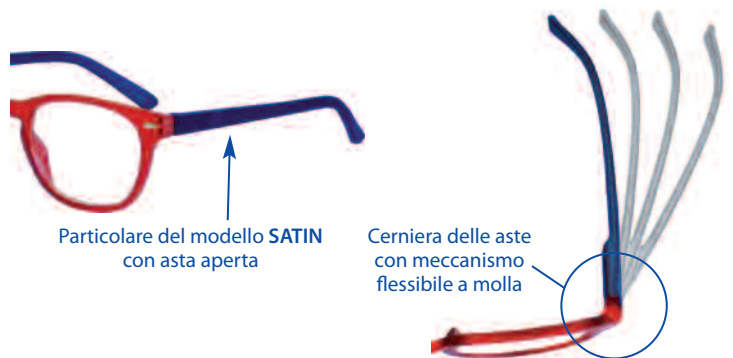
Particolare del modello SATIN con asta aperta

Confezione/espositore da banco per 24 occhiali. Dimensioni dell'espositore: larghezza cm 23, profondità cm 30, altezza cm 35 Completo di specchio, test per autodiagnosi della vista.