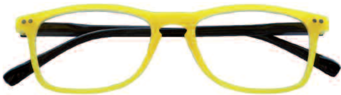
Mod. SPRING frontale giallo, aste nere