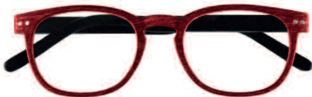
Mod. WENGÈ rosso con effetto legno