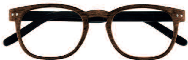
Mod. WENGÈ marrone con effetto legno