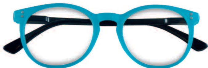
Mod. COLOR azzurro - aste multicolori