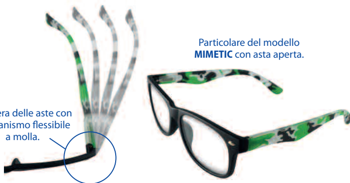
Particolare del modello MIMETIC con asta aperta.

Confezione/espositore da banco per 24 occhiali. Dimensioni dell'espositore: larghezza cm 23, profondità cm 30, altezza cm 35. Completo di specchio, test per autodiagnosi della vista.