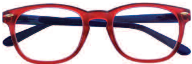
Mod. SATIN frontale rosso, aste blu