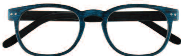
Mod. WENGÈ blu con effetto legno