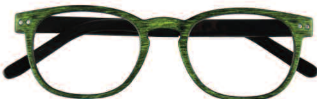
Mod. WENGÈ verde con effetto legno