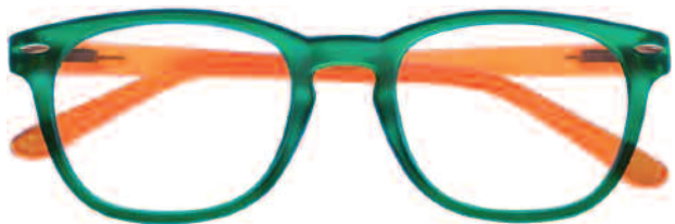
Mod. SATIN frontale verde, aste gialle