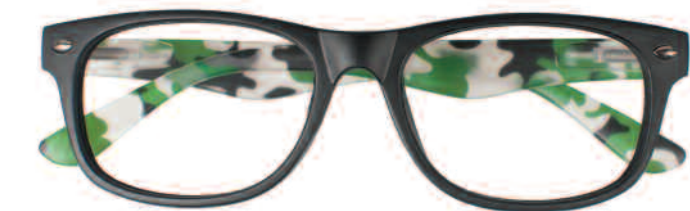
Mod. MIMETIC nero - aste maculate verde, bianco, nero