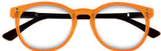
Mod. COLOR arancio - aste multicolori