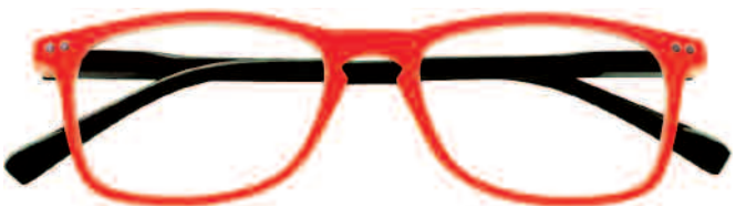
Mod. SPRING frontale rosso, aste nere