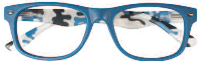
Mod. MIMETIC blu - aste maculate blu, bianco, nero