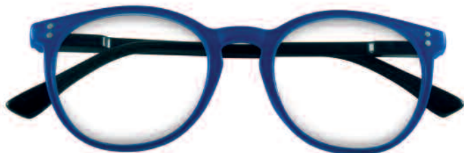
Mod. COLOR blu - aste multicolori