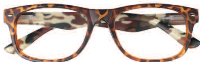
Mod. MIMETIC tartaruga - aste maculate marrone, avorio, nero